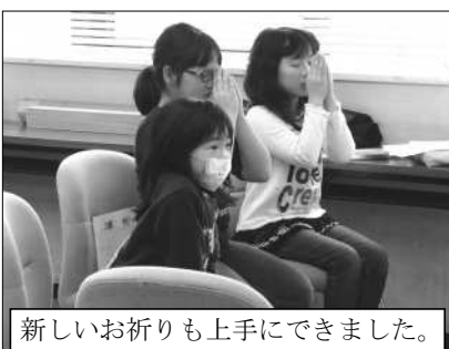
新しいお祈りも上手にできました。

合掌ありがとうございます。いつも、世界を担う素晴らしい神の子を育てる生命学園にご支援、ご協力いただきありがとうございます。今回は、1月20日(土)に