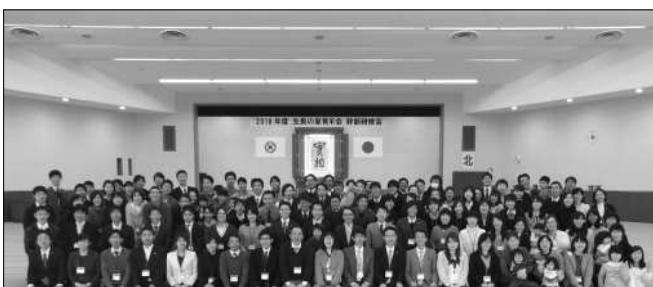
全国から幹部研修会に参加した青年会幹部のみなさん。