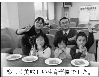
楽しく美味しい生命学園でした。