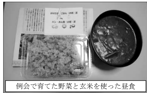
例会で育てた野菜と玄米を使った昼食