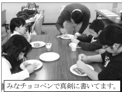
みなチョコペンで真剣に書いてます。

その後、幼い頃から自分の夢を追いかけ、努力して夢を叶えたステイブンスン(蒸気機関車実用化の第一人者)のお話や、自分のよさを認め、自分を好きになることも夢を叶えるため