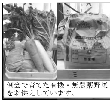
例会で育てた有機・無農薬野菜をお供えしています。

会員皆様の家庭と事業の繁栄、そして神様の御心を、お一人お一人のうえに頭し給えと真心を込めて祝福祈願を行いました。神前には、支部例会「地産地消勉強会」として取り組み、有機栽培で育てた野菜などをお供えしました。祝福祈願後は、参加者全員で円になり、松井先生のお話と、公開個人指導で、今回も東京、名古屋など遠方からのご参加もあり、深い真理のお話に笑顔でお帰りになりました。