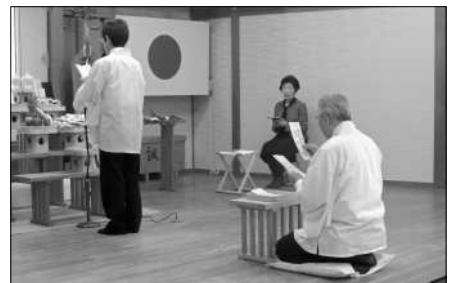
毎月行われる祝福祈願祭の様子

大700名を大きく掲げさせて頂きましたが、先輩の皆様、会員の皆様、役員・支部長の皆様のおかげで、一年で達成させて頂きました。心より有り難く御礼申し上げます。