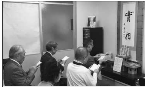
毎朝行われる会員の祝福祈願