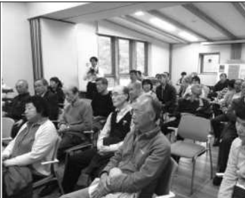
トークイベントを聞く受講者

たいと思います。22日のトークイベントでは30分のショートムービー上映後、感想、そして有機農家になる以前と以後で変わったこと、面白いことや難しいと感じること、普段の過ごし方について、もう一方、地元の有機農家さんと交互に話させていただきました。本当に貴重な体験ばかりでした。先日、和田先生からご指