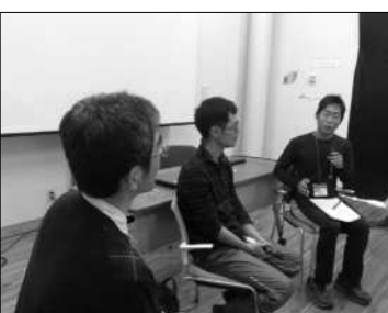
本部でのトークイベントの様子

屋台の運営ではほうれん草のポタージュを担当させていただきました。想像していたよりも簡単に作れるもので、また色々な行事の中で再現したものを提供し