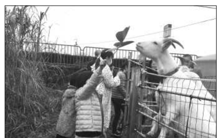
葛の葉をいっぱいあげました